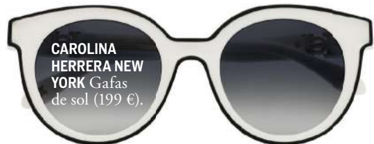
CAROLINA HERRERA NEW YORK Gafas de sol (199 €).

MIRADA 'IT' Carolina Herrera reinterpreta los códigos de la casa en 'Glamour', su nuevo modelo de gafas de sol ( carolinaherrera.com )